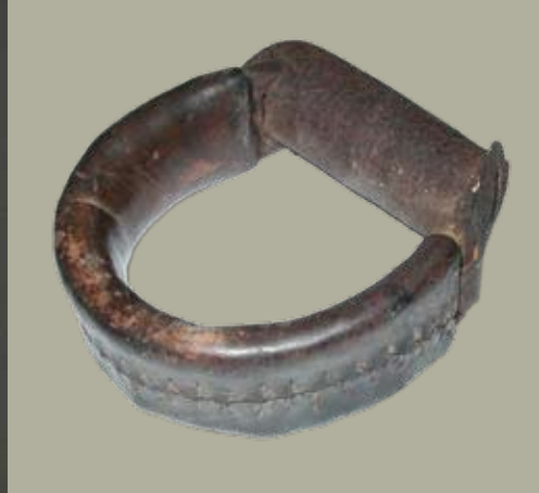
Caethgadwynau haearn i roi ar goesau

diwydiant llechi yn y gogledd a'r diwydiant metel yn y de'n cael eu hariannu'n bennaf gan y fasnach.