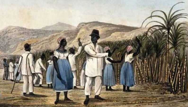
Caethweision yn gweithio ar blanhigfa siwgr