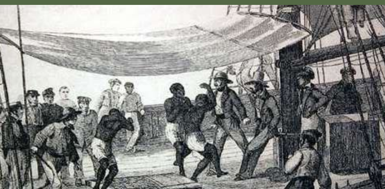
Caethweision wedi'u cipio ar fwrdd llong