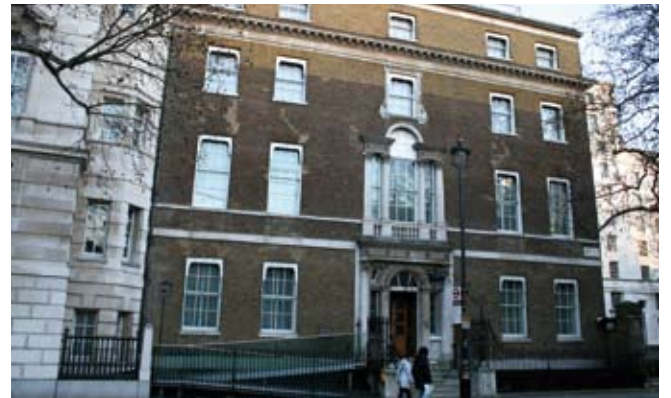
Tŷ Gwydyr, Llundain

Y Comisiwn oedd un o ganlyniadau mwy dadleuol diddymu caethwasiaeth. Fe'i sefydlwyd yn 1833 yn dilyn penderfyniad Llywodraeth Prydain i neilltuo £20 miliwn i dalu iawndal i blannwyr, masnachwyr caethweision a pherchnogion caethweision am y diddymu. Eleni, byddai'r ffigwr hwnnw'n cyfateb i £2biliwn. Ni ddyfarnwyd ceiniog erioed i gyn gaethwas.